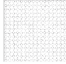
TAEB01 modulo module