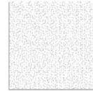
TAEB05 modulo module