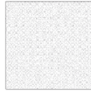
TAEB03 modulo module