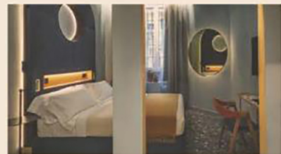
Rassicurante. Una delle suites realizzate da Moroso