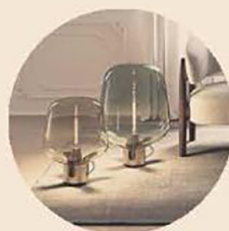
FLAR, UNA LAMPADA NEL VENTO Flar, progettata da Patrick Norguet per Lodes, è la lampada da appoggio dalle evocative forme minimaliste che trae ispirazione dalle tradizionali lanterne antivento