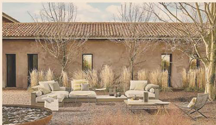
Salotto in giardino. Flexform, Hamptons, design Antonio Citterio