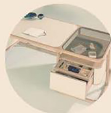
ISABEL, RITORNO AL CLASSICO Morelato presenta la scrivania Isabel: disegnata da Libero Rutilo celebra il ritorno delle scrivanie classiche ma si inserisce al meglio anche in contesti contemporanei