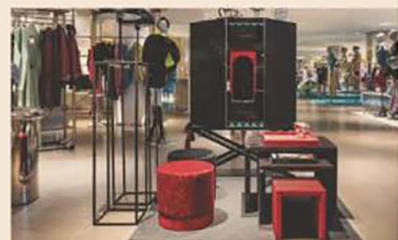
In Rinascente. La collezione Scintilla presentata a Milano