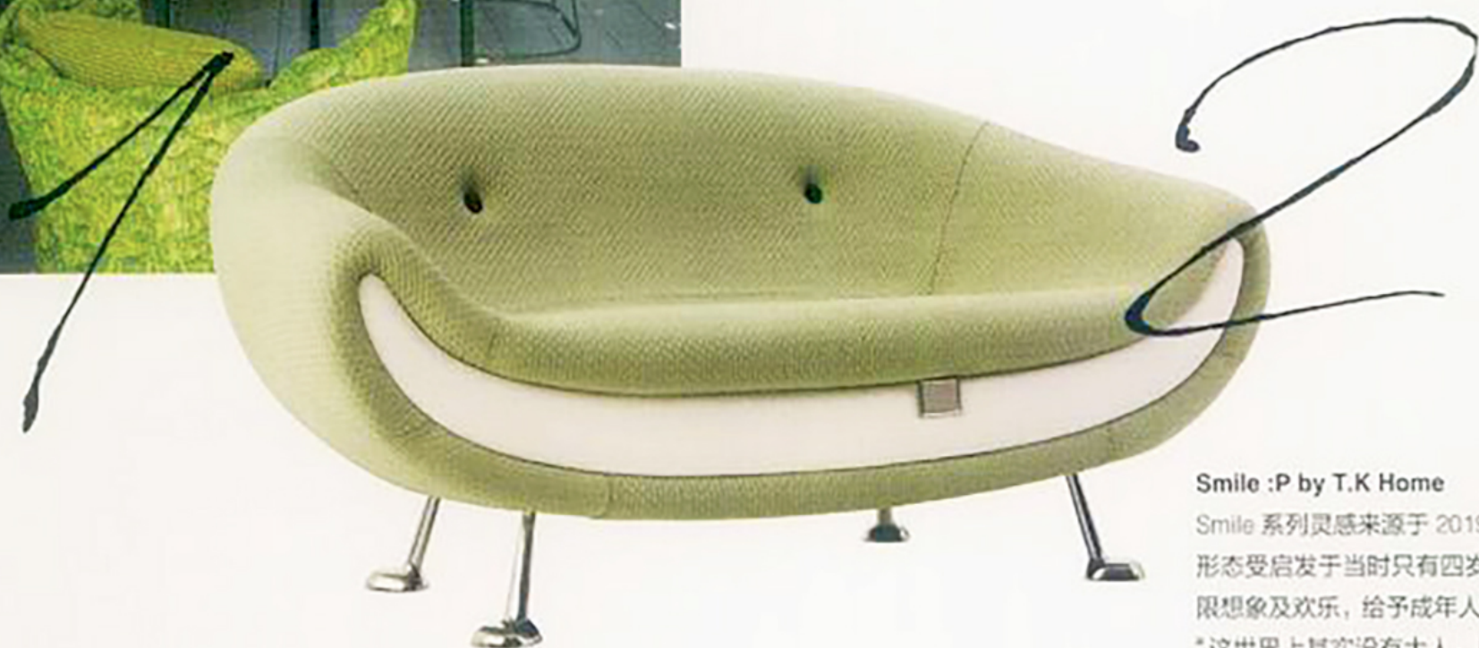
Smile :P by T.K Home

绿色可以应用在浪漫气息浓郁的法式风格当中，亦可以在美式乡村风格的墙面上见到这抹象征自然的颜色，搭配圆润的家居线条，空间被营造得很柔和、悠然、轻松愉快。