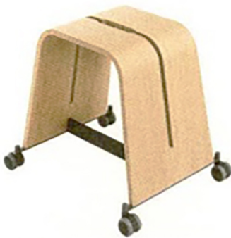
Ein Skateboard zum Hocken: Boards BO200 von Brunner