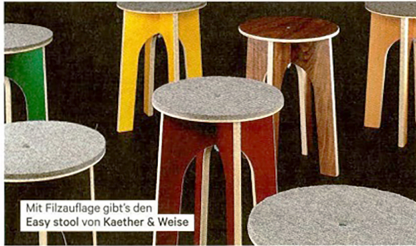
Mit Filzaufgabe gibt's den Easy stool von Kaether & Weise