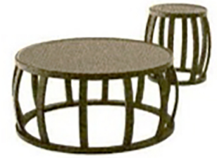
Erinnert an Trommeln: Loto von Maxalto