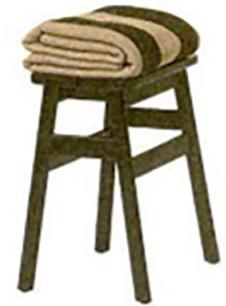
Keep it simple: Hocker aus der Kollektion Angle von Form & Refine