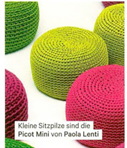
Kleine Sitzpilze sind die Picot Mini von Paola Lenti