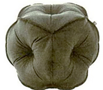
Knautschzone 953 von Rolf Benz

Hocker zählen zwar nicht zu den Big Five der Möbelwelt, die kleinen Kerlchen sollten aber auf keinen Fall unterschätzt werden. Ausgewählte Highlights