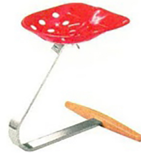
Zur Superikone wurde 220 Mezzadro von Zanotta