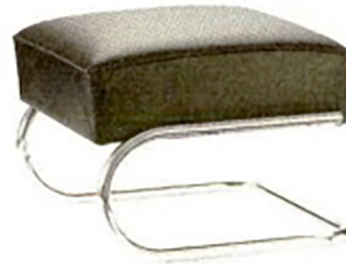
Der Stahlrohrklassiker S 411 H von Thonet