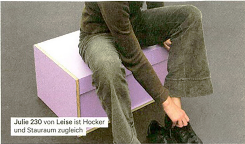
Julie 230 von Leise ist Hocker und Stauraum zugleich