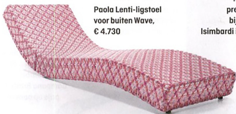
Paola Lenti-ligstoel voor buiten Wave, € 4.730

Loewe-stoelen tijdens de presentatie bij Palazzo Isimbardi in Milaan