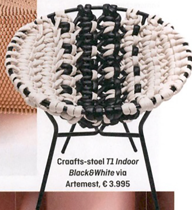
Craafts-stoel T1 Indoor Black&White via Artemest, € 3.995