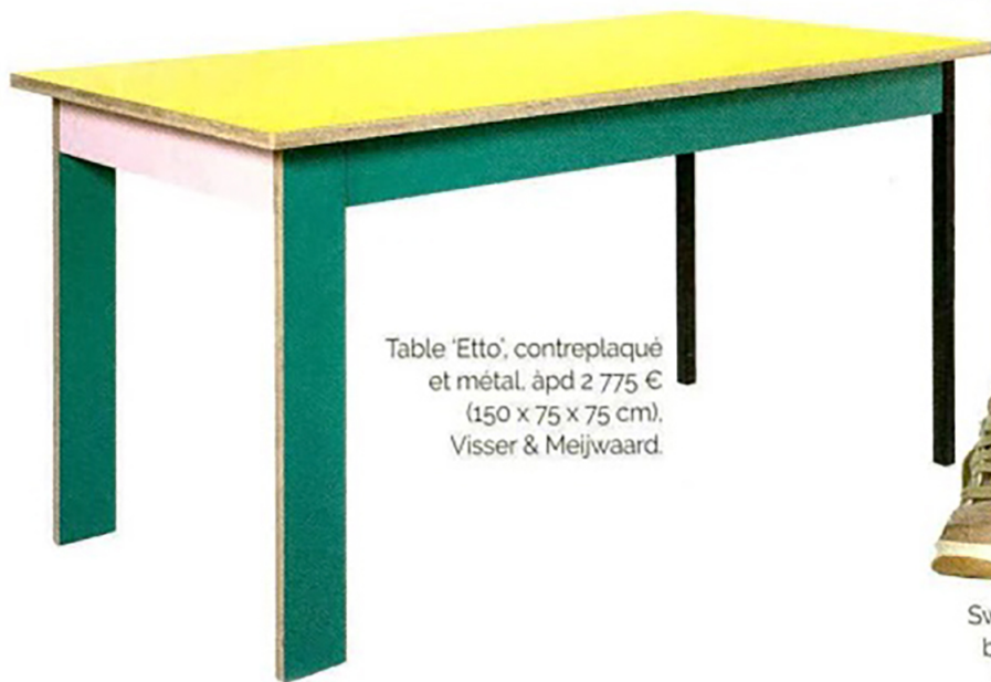
Table 'Etto', contreplaqué et métal, à pd 2 775 € (150 x 75 x 75 cm), Visser & Meijwaard.

Sac 'Anton Sling', cuir de veau très souple, 1 500 €. Loewe.