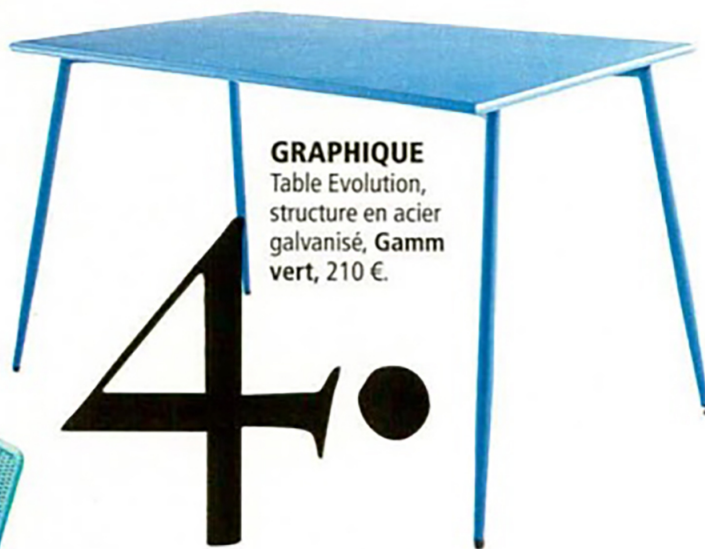
Table Evolution, structure en acier galvanisé, Gamm vert, 210 €.