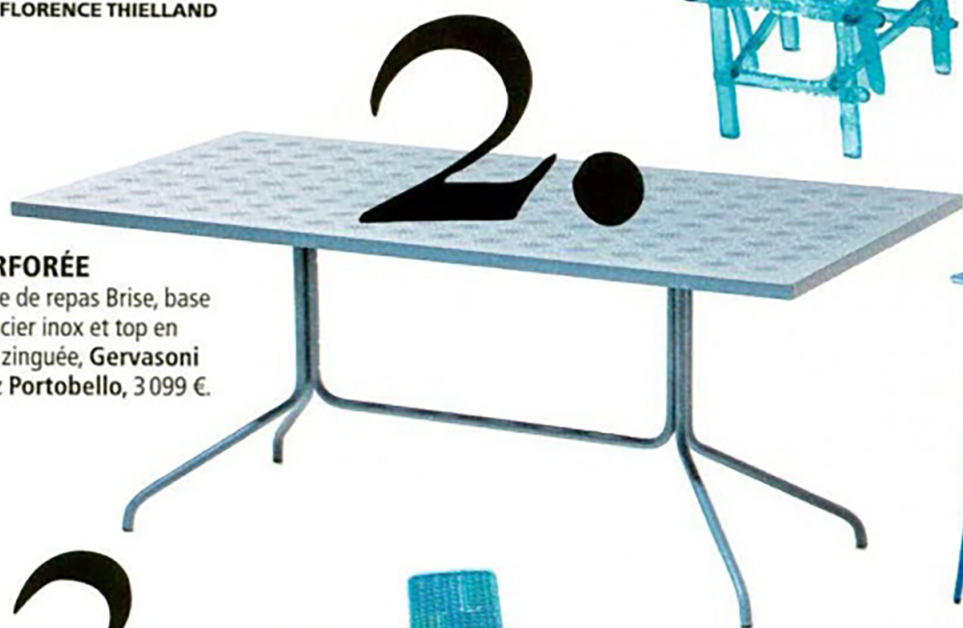
Table de repas Brise, base en acier inox et top en tôle zinguée, Gervasoni chez Portobello, 3 099 €.