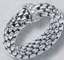
Fope Vendôme Ring