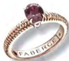
Fabergé Colours of Love Ruby Ring