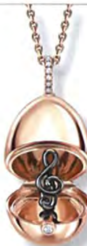
Fabergé Medaillon Surprise