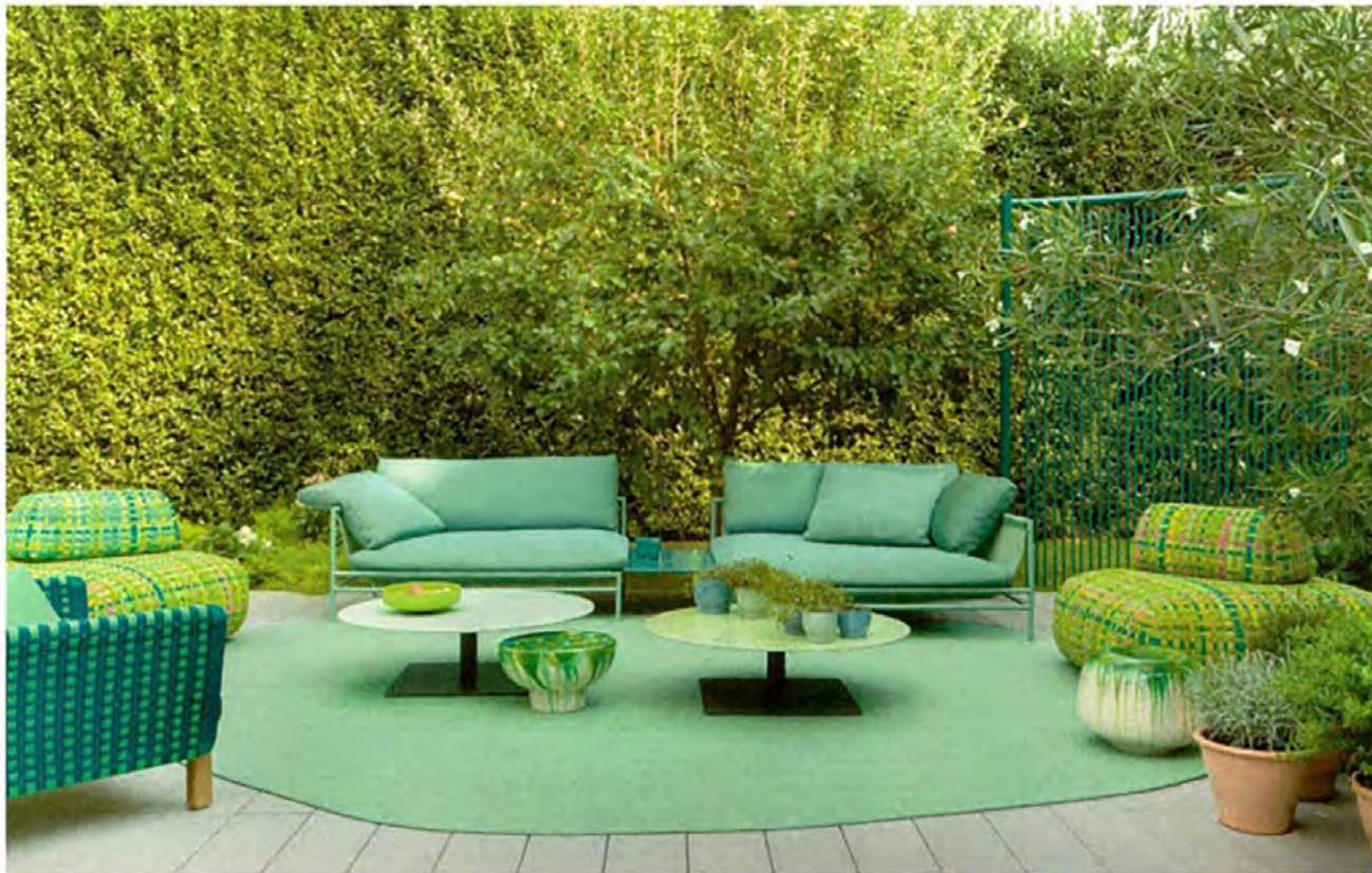
PAOLA LENTI, Giro collection, tops by Nicolo Morales - paolalenti.it