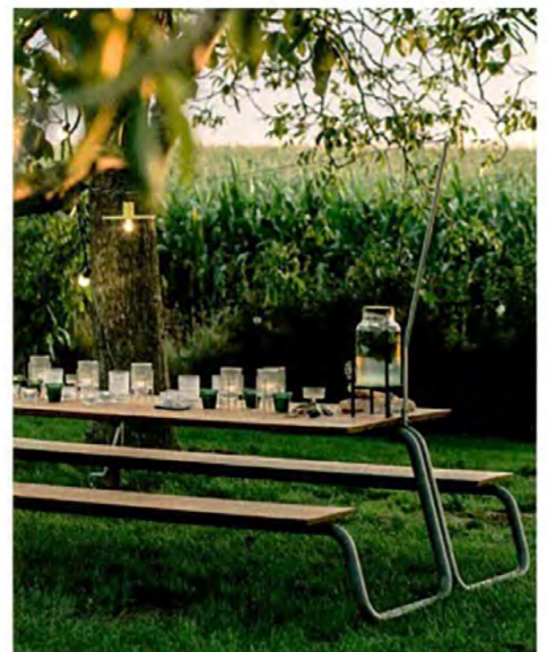
WUNDER, The Table - wunder.be