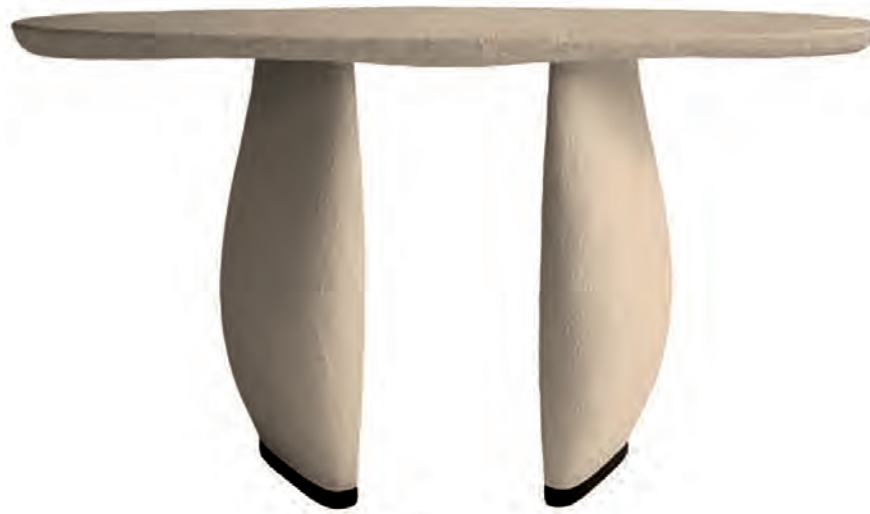
BIOBJECT, Air collection, Dolomie table, design Joëlle Rigal - biobject.com