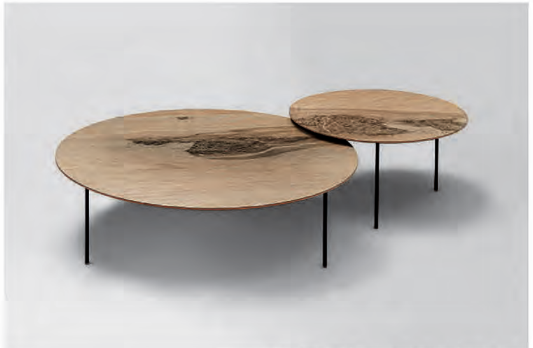
PAOLA LENTI, Elio tables - paolalenti.it © Sergio Chimenti