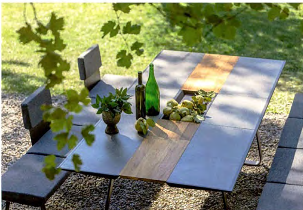
EGO PARIS, Extradados table and benches - egoparis.com

The trend towards customisation is also making itself felt in the world of tables, and within a single collection you can often define your own criteria. At Extradados, the tops can be chosen in ceramic or Corian, while the central table runner is available in aluminium, teak or Corian. Mixing materials is very much the order of the day and aluminium and steel are often combined with wood (Fast). At Paola Lenti, small round coffee tables can be joined to a rectangular coffee table to enlarge it. At Gandia Blasco, the tables are collected together to create an archipelago. ▶