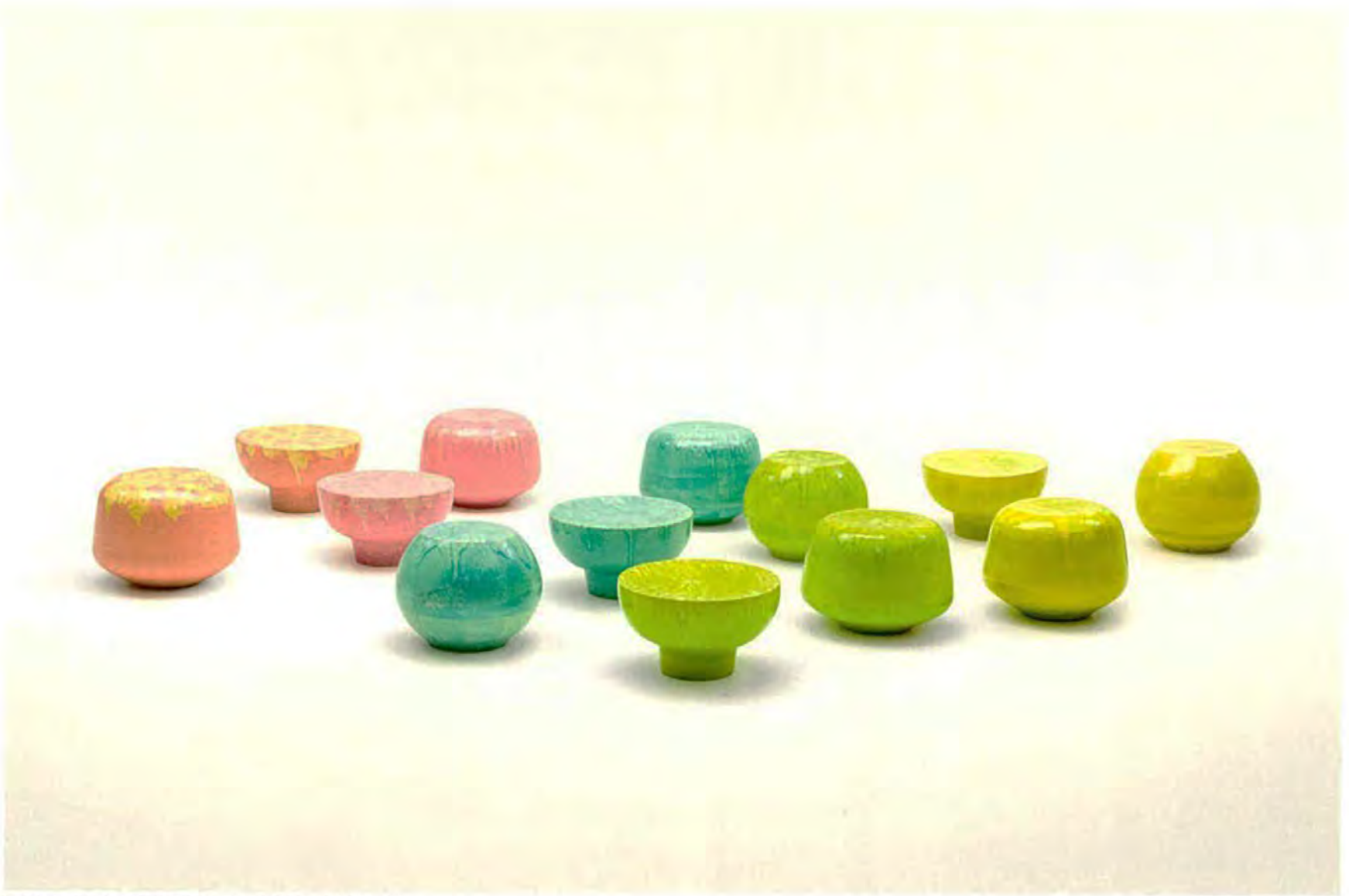
Calatini collection