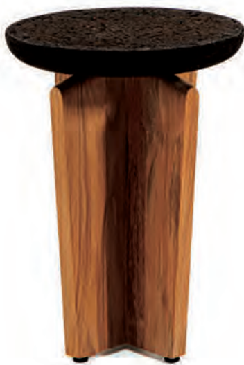
ETHIMO, Cross occasional table, design Patrick Norguet - ethimo.com

The exploration of poor materials such as papier-mâché requires hand-modelling on a wood and cardboard base to shape massive and supple forms, without generating any waste, evoking a mineral relic. FSC® teak, heat-treated oak, natural or ecologically roasted cork are all textures that are suitable for outdoor use. When it comes to the material, economy is factored in from the very first sketches of the designer. One example is the insertion of a linen cloth between two wooden parts to obtain resistant, finer and stable surfaces. □