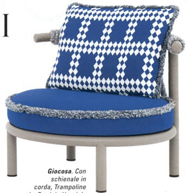
Giocosa. Con schienale in corda, Trampoline by Patricia Urquiola per Cassina.