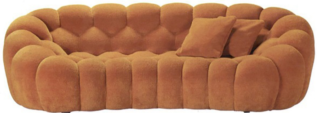
Avvolgente. Il divano Bubble 2 firmato da Sacha Lakic per Roche Bobois.