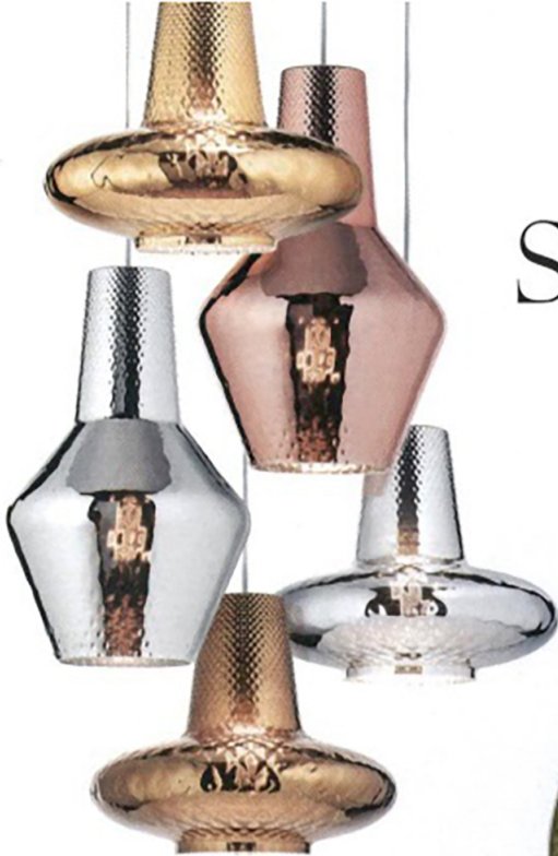
A sospensione. Romeo e Giulietta, in vetro soffiato con finitura balloton. Di Zafferano.