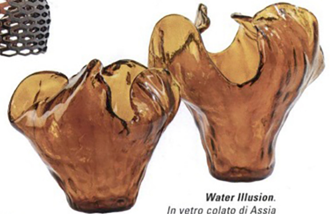
Water Illusion. In vetro colato di Assia Karagiuzova per Poltrona Frau.