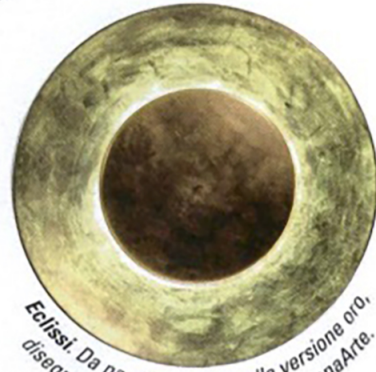
Eclissi. Da parete Lunaire nella versione oro, disegnata da Ferréol Babin per FontanaArte.