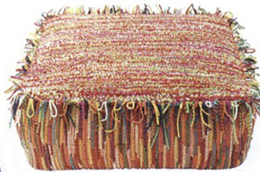
Upcycling. Pouf in tessuto bouclé realizzato a mano a telaio by Paola Lenti.