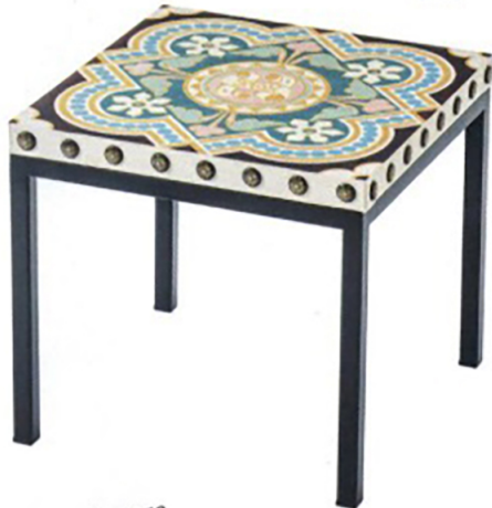
Not a Harem. Tavolino in metallo con piano in piastrelle moresche. Di Moroso.