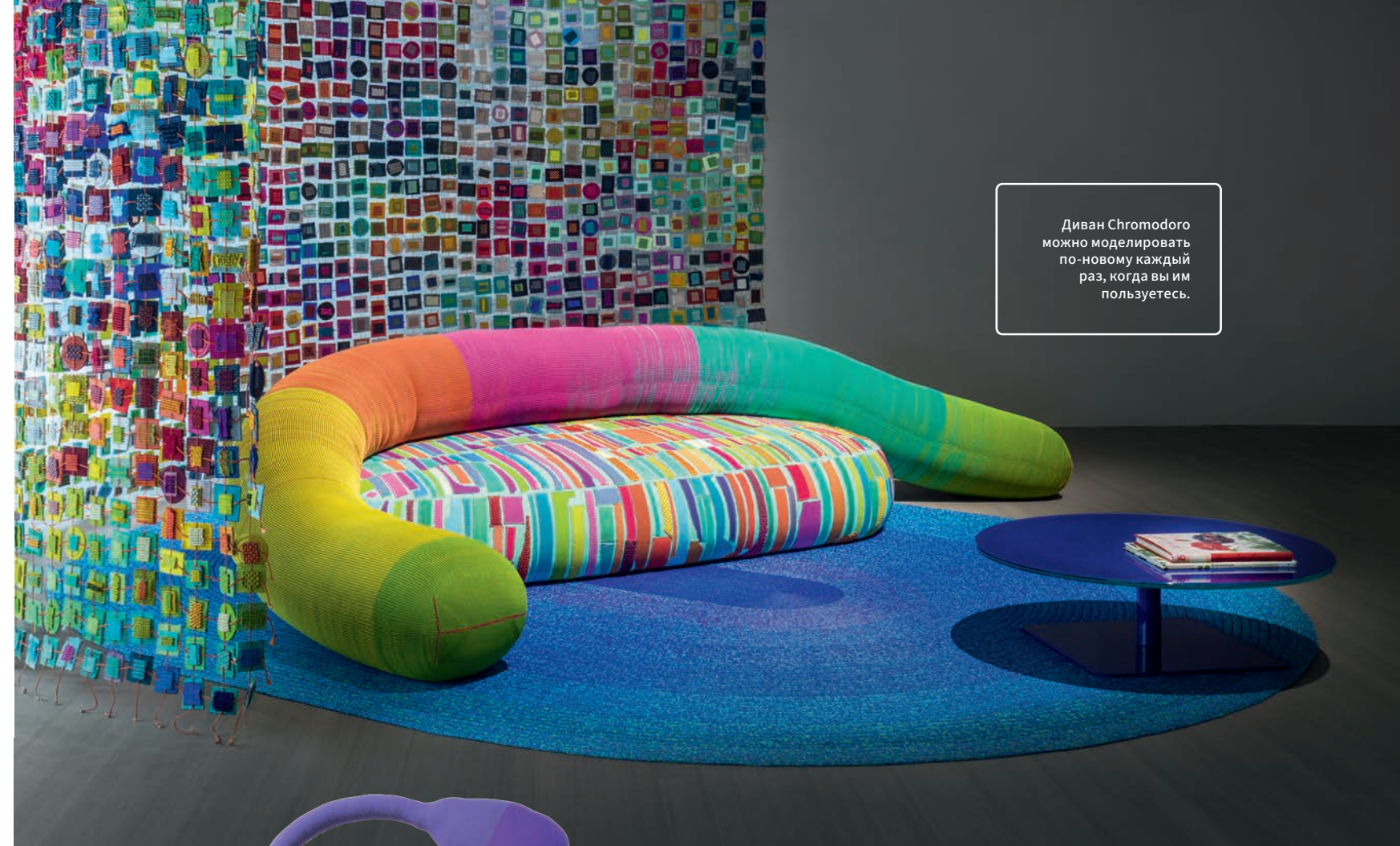
Диван Chromodoro можно моделировать по-новому каждый раз, когда вы им пользуетесь.

У меня лично сильное отвращение к излишнему украшательству. Когда я работаю над дизайном нового объекта, я фокусируюсь на нем самом, на его функции, стараюсь избегать ненужных элементов, декоративных приемов. Для меня жизненно важны и очень сильно взаимосвязаны два понятия: простор и баланс. Достичь гармонии между функциональностью и эстетикой — не такой уж большой подвиг для дизайнера, но он освобождает от часто меняющихся трендов. Также очень важны материалы. Их нужно выбирать, отталкиваясь от качества и эмоций, которые они вызывают. И нельзя забывать про подборку цветов. Я никогда не думаю о цвете применительно к конкретному продукту, скорее я смотрю на то, как цвет работает в контексте, пробуждает ли он приятные чувства. Цвет — это оболочка эмоции, а хорошее самочувствие связано с нашими эмоциями.