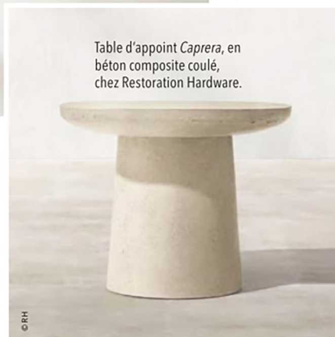
Table d'appoint Caprera , en béton composite coulé, chez Restoration Hardware.