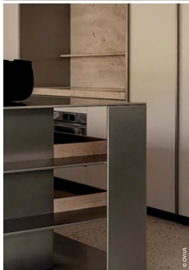
Détail de la cuisine Silver Lining chez Ovius.