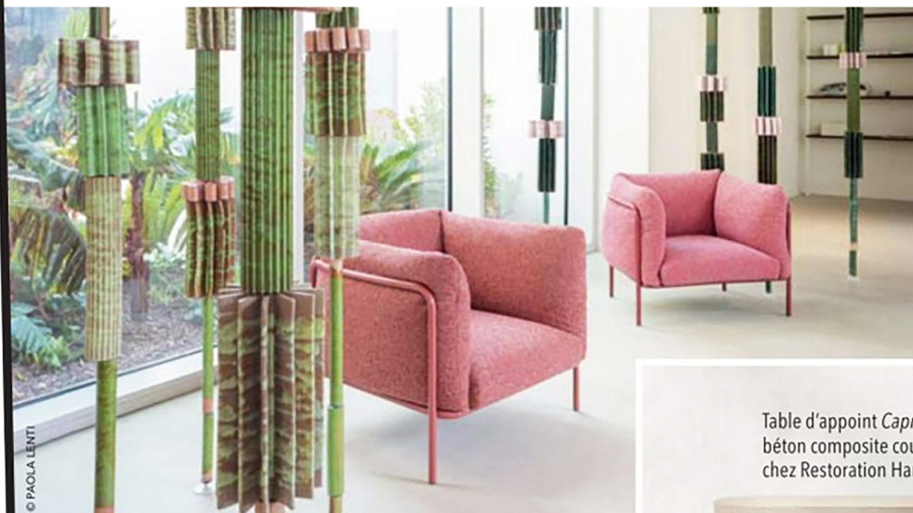
Fauteuil Pli , édité chez Paolo Lenti.