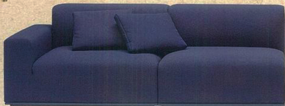
Cover沙发 模块化沙发设计,按不同风格组合搭配,茶几以哑光漆木纤维作为结构,经久耐用,面料和颜色多种多样。Faola Lenti价洽店内