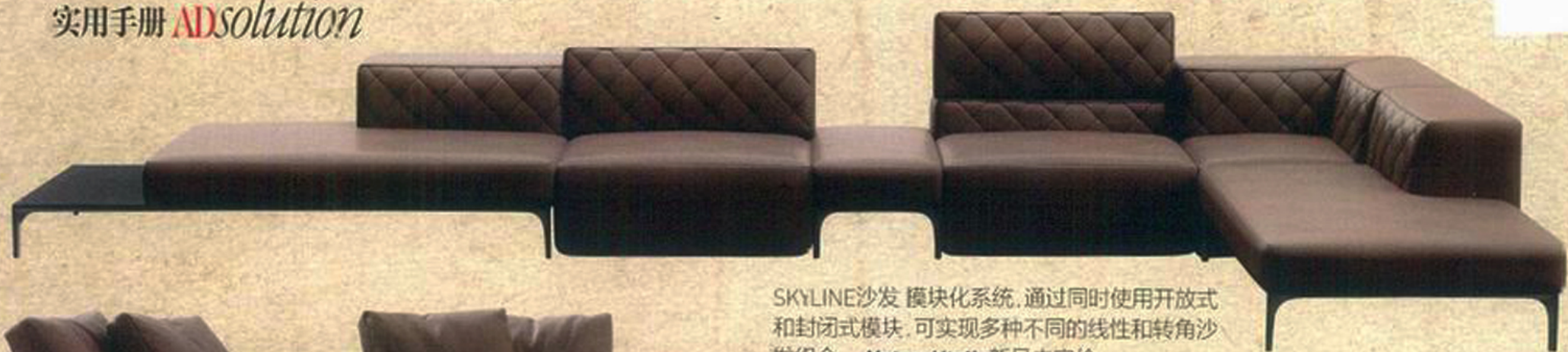
SKYLINE沙发 模块化系统,通过同时使用开放式和封闭式模块,可实现多种不同的线性和转角沙发组合。Natuzzi Italia新品未定价