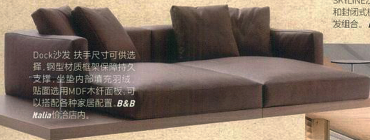
Dock沙发 扶手尺寸可供选择,钢型材质框架保障持久支撑,坐垫内部填充羽绒,贴面选用MDF木纤面板,可以搭配各种家居配置。B&B Italia价洽店内。

宽体沙发像个“治愈系的胖子”,极具亲和力,随便一放,深陷其中,任你“瘫”到地老天荒,不能更接地气。