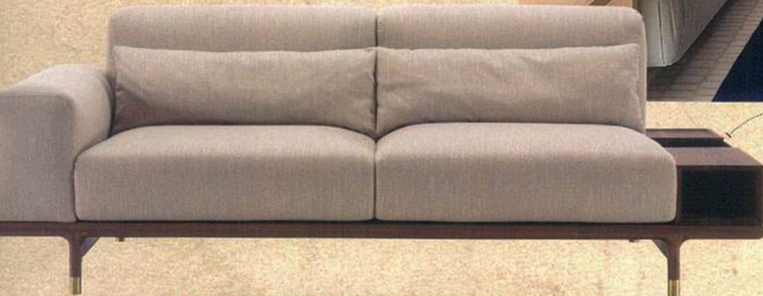
Argo沙发 模块化座椅系统,主体框架采用坚固的canaletta胡桃木,落脚采用拉斯黄铜,增强稳固性,连体茶几可随心放置物品,具有开合功能,里面可作为杂志收纳,设计感和实用性兼备,织物面料可卸下更换,便于清洁。Porada价洽店内