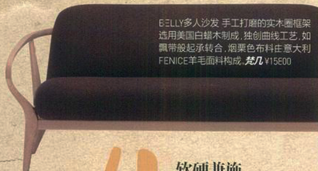
BELLY多人沙发 手工打磨的实木圈框架,选用美国白蜡木制成,独创曲线工艺,如飘带般起承转合,烟栗色布料在意大利FENICE羊毛面料构成,茶几¥15E00