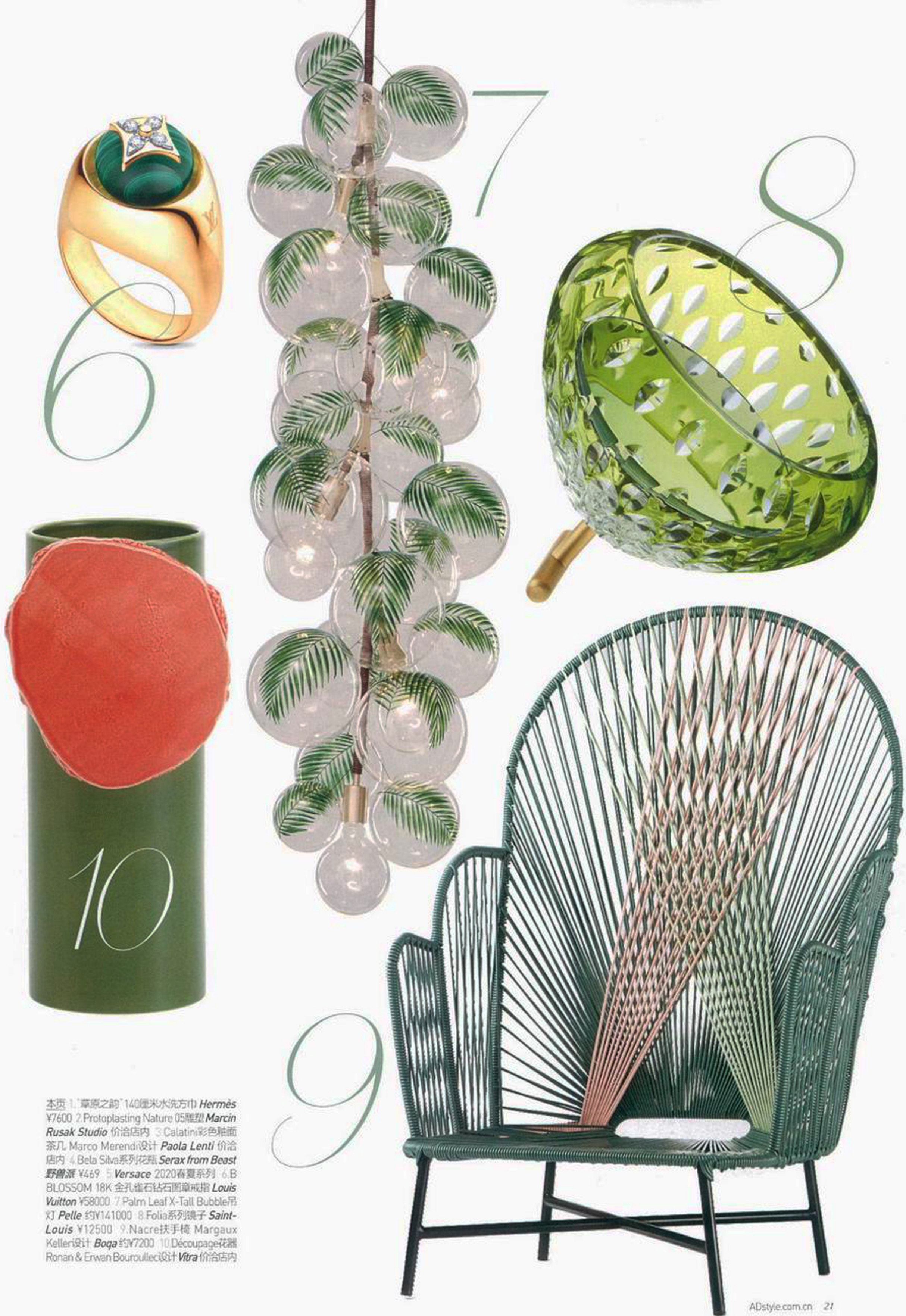
本页 1. “草原之韵”140厘米水洗方巾 Hermès ¥7600 2. Protoplating Nature 05雕塑 Marcin Rusak Studio 价洽店内 3. Calatini彩色釉面茶几 Marco Merendi 设计 Paola Lenti 价洽店内 4. Bela Silva系列花瓶 Serax from Beast 野奢派 ¥469 5. Versace 2020春夏系列 6. B BLOSSOM 18K 金孔雀石钻石图案戒指 Louis Vuitton ¥58000 7. Palm Leaf X-Tall Bubble吊灯 Pelle 约¥141000 8. Folia系列镜子 Saint-Louis ¥12500 9. Nacre扶手椅 Margaux Keller 设计 Boqa 约¥7200 10. Découpage花瓶 Ronan & Erwan Bouroullec 设计 Vitra 价洽店内