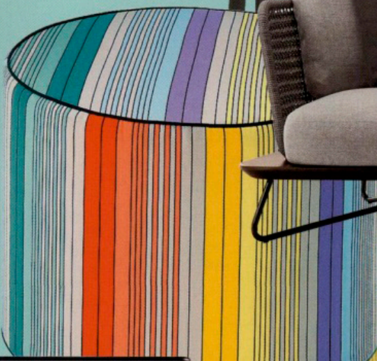
POUF en polyacrylique, L 40 × I 30 cm, design Rosita Missoni, Samana , 368 €, MISSONI.