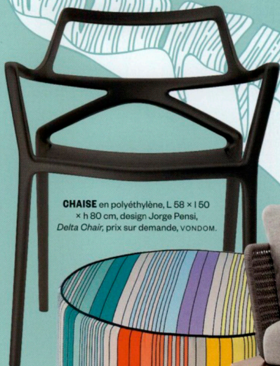
CHAISE en polyéthylène, L 58 × I 50 × h 80 cm, design Jorge Pensi, Delta Chair , prix sur demande, VONDOM.