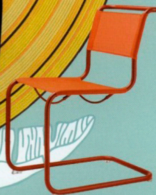
CHAISE en métal laqué et résille synthétique, L 50 × I 64 × h 46 cm, design Mart Stam (1926), S 33 Quatre Saisons , à partir de 580 €, THONET.