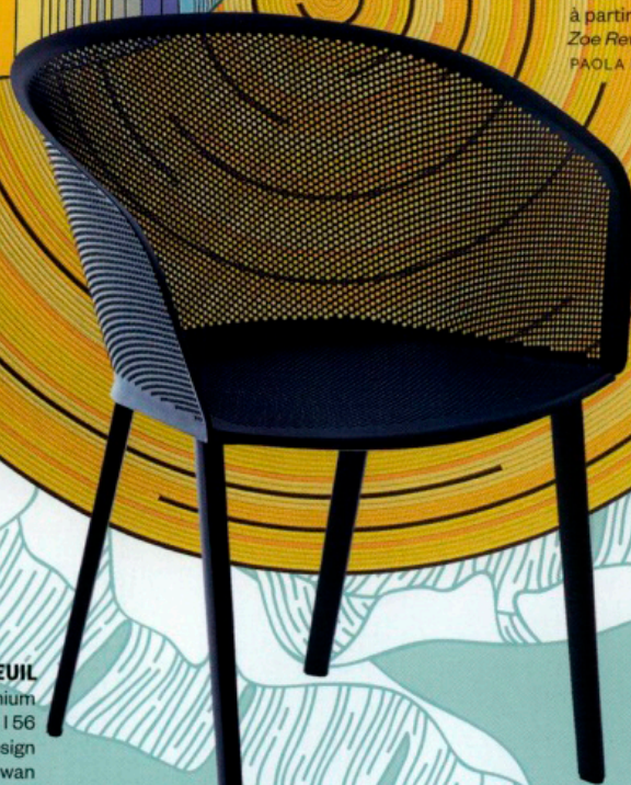
FAUTEUIL en aluminium perforé, L 69 × I 56 × h 80 cm, design Ronan and Erwan Bouroullec, Stampa , 595 €, KETTAL.