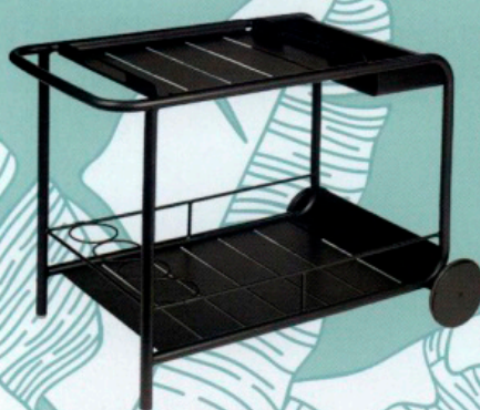
TROLLEY en aluminium laqué, L 77 × I 49 × h 67 cm, design Frédéric Soña, 499 €, FERMOB.