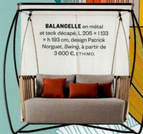
BALANCELLE en métal et teck décapé, L 205 × I 133 × h 193 cm, design Patrick Norguet, Swing , à partir de 3 600 €, ETHIMO.