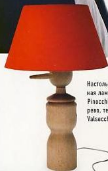
Настольная лампа Pinocchio, дерево, текстиль, Valsecchi 1918.