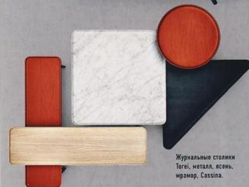
Журнальные столики Togo, металл, ясень, мрамор, Cassina.