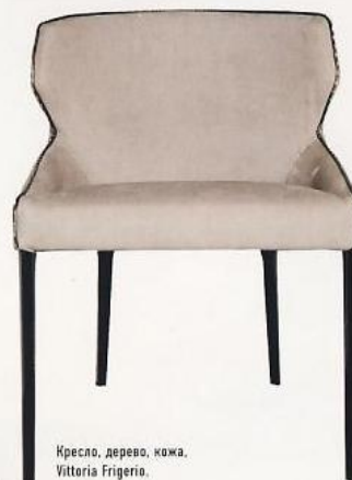
Кресло, дерево, кожа, Vittoria Frigerio.