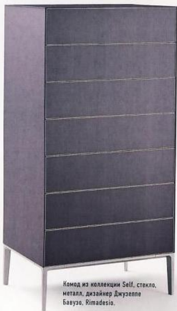
Комод из коллекции Self, стекло, металл, дизайнер Джузеппе Бавузо, Rimadesio.