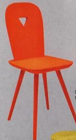
Стул La-Dina, ясень, Casamania.