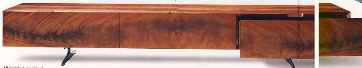
Консоль для телевизора Piuma, дерево, Flexform.