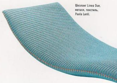
Шезлонг Linea Due, металл, текстиль, Paola Lenti.