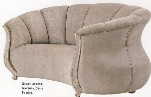
Диван, дерево, текстиль, Savio Firmo.