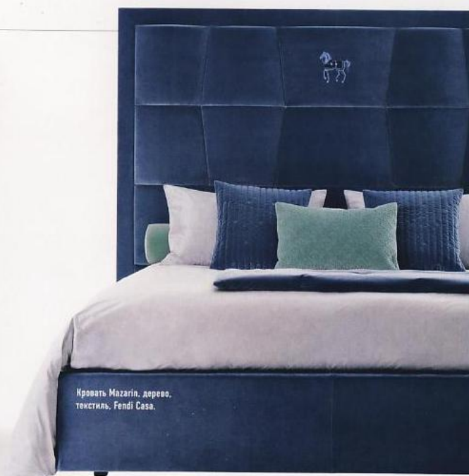
Кровать Mazarin, дерево, текстиль, Fendi Casa.