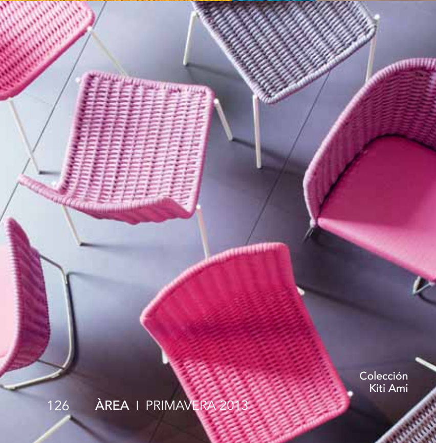
Colección Kiti Ami