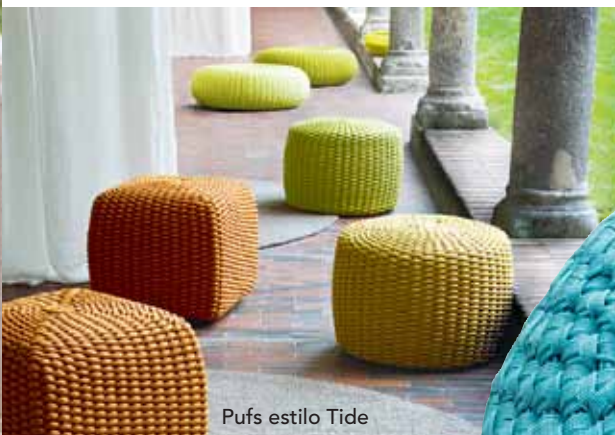
Pufs estilo Tide