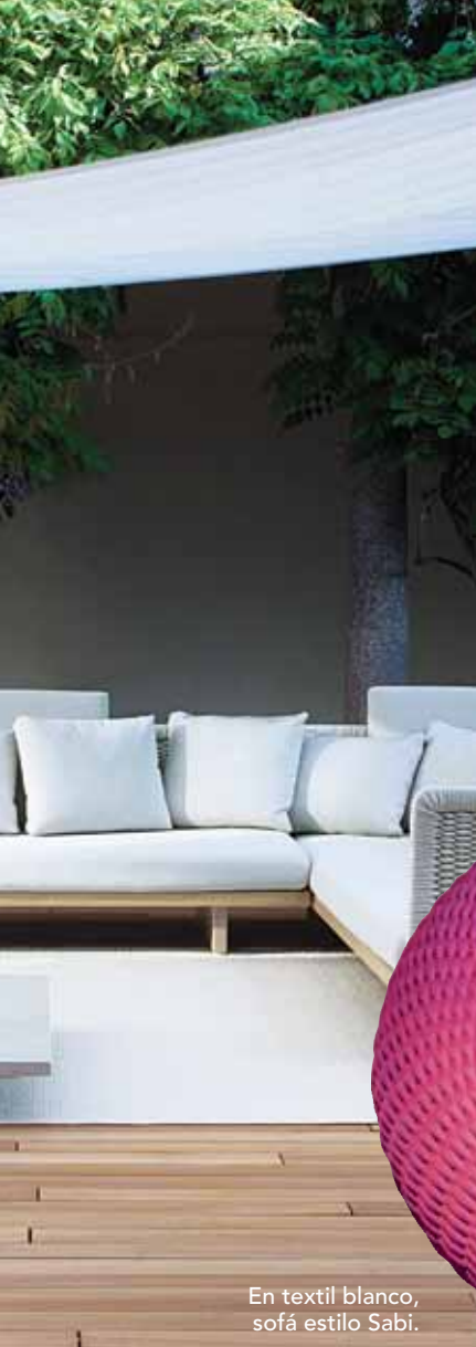
En textil blanco, sofá estilo Sabi.

Hoy, las alfombras de Paola Lenti sorprendentemente aptas para exterior son uno de los sellos distintivos de la empresa. Se producen básicamente con dos materiales de alta tecnología; la fibra llamada Aquatech y laRope (soga),