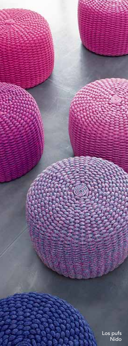
Los pufs Nido