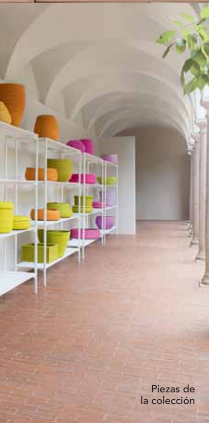
Piezas de la colección