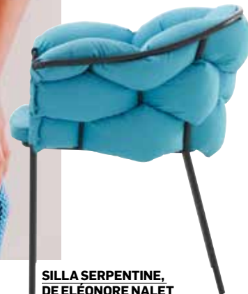
SILLA SERPENTINE, DE ELÉONORE NALET