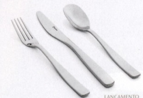
LANÇAMENTO FAQUEIRO WISH

DECOR • ARTE DA MESA • PRESENTES • FAQUEIROS LOJA SHOPPING D&D • PISO TÉRREO saintjames.com.br • TEL: (11) 3043-6612