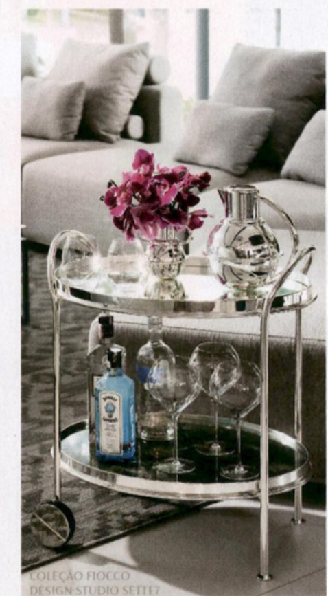
COLEÇÃO FIOCCO DESIGN STUDIO SEITE7