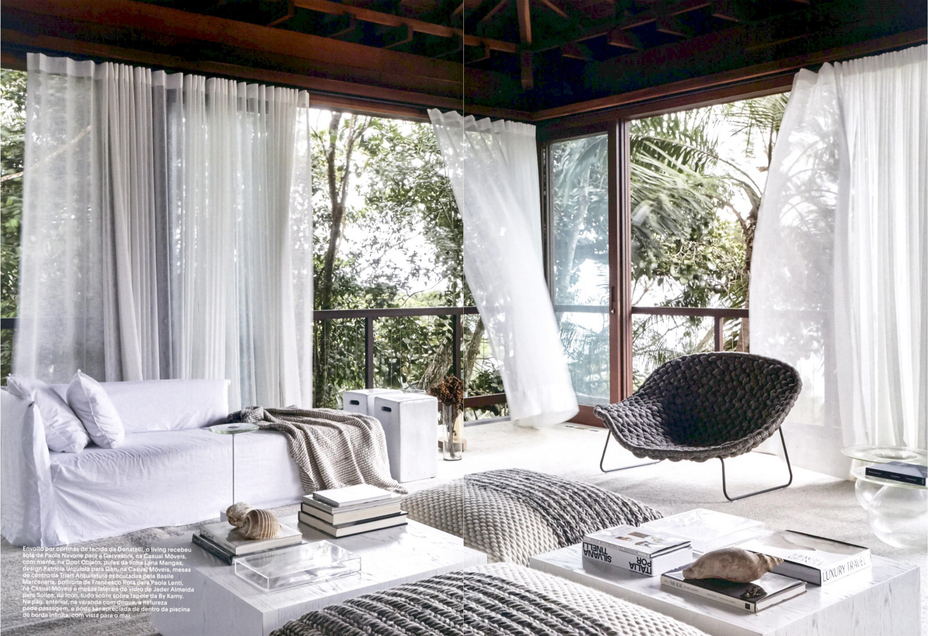
Envolto por cortinas de tecido da Donatelli, o living recebeu sofá de Paola Navone para a Gervasoni, na Casual Móveis, com manta, na Dpot Objeto, pufes da linha Lana Mangas, design Patrícia Urquiolá para Gan, na Casual Móveis, mesas de centro da Triart Arquitetura executadas pela Basile Marcenaria, poltrona de Francesco Rota para Paola Lenti, na Casual Móveis e mesas laterais de vidro de Jader Almeida para Sollos, na Icon, tudo sobre sobre tapete da By Kamy. Na pág. anterior, na varanda com deque, a natureza pede passagem, e pode ser apreciada de dentro da piscina de borda infinita, com vista para o mar