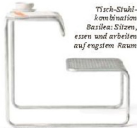
Tisch-Stuhl-Kombination Basilea: Sitzen, essen und arbeiten auf engstem Raum

am Kopfende an einer Feder-Seilaufhängung. Wird die Liege auf dem Balkon nicht mehr gebraucht oder es naht der Winter, lässt sie sich – im Vergleich zu anderen Modellen – recht leicht verstauen. Ebenfalls bei Tecta im Programm ist der faltbare Sessel „D4“, den Marcel Breuer 1927 entwarf. Schon in den 20er-Jahren wurde die Klappversion, die es in Stahlrohr vernickelt oder Edelstahl mit strapazierfähigen Outdoor-Gurten gibt, als das ideale Sitzmöbel für Terrassen, Gärten und Gartencafés angepriesen, schließlich ist es mobil und gibt Raum frei, wenn es nicht benötigt wird.