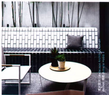
意大利 Landscape Architects Neri &amp; Huber

在改造空间外设墙面时，注意不要破坏建筑原有的保温层，做好隔水、排水。一些时下热门的复合材料有性能稳定、抗挤压、防潮防腐、抗霉变、耐用的特性，如木塑复合材料、麻丝板等，较适合低维护花园的铺设。