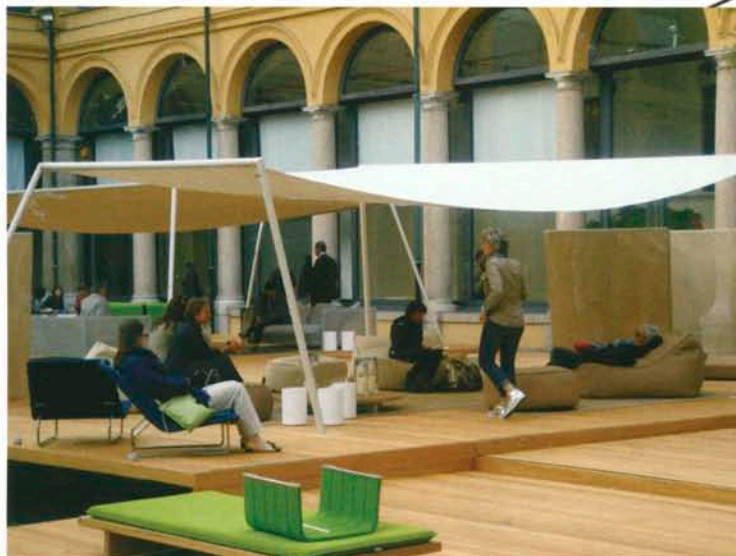
Paola Lenti, showroom temporaire au Palazzo delle Stelline.