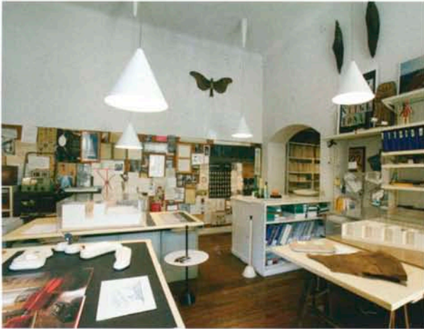
Achille Castiglioni Museum.