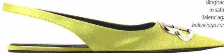
ULTRAFLAT Ballerine slingback in satin, Balenciaga. balenciaga.com