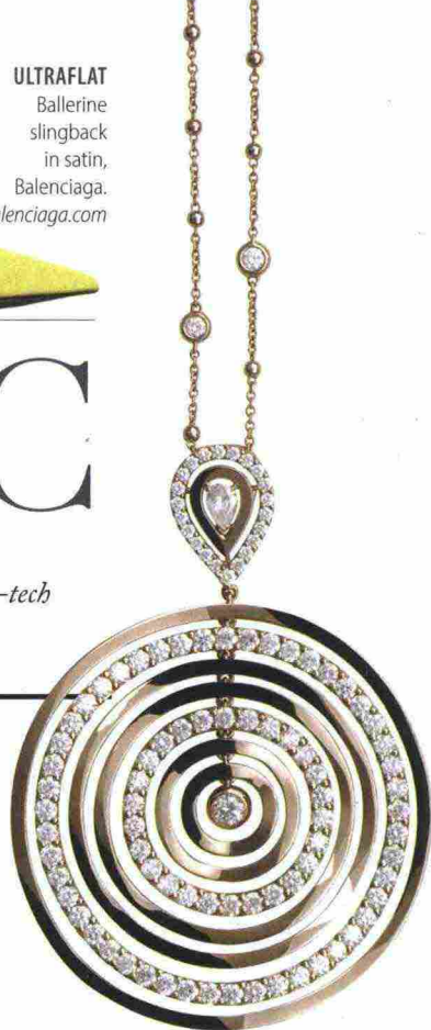
MACRAMÈ IPNOTICO Sotto, tappeto in corda, Ladybird di Paola Lenti. paolalenti.it Sopra, pendente in oro rosa e brillanti, Crivelli. crivelligioielli.com