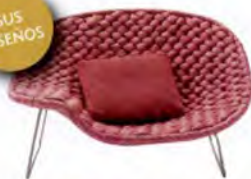
JARDÍN TRENZADO. "Chaise longue" Shito con estructura de acero y "tapicería" en trenza. Desde 4.100 euros.