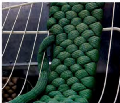
TRENZADO. Detalle de la fibra de última generación desarrollada en el centro de producción de Paola Lenti.