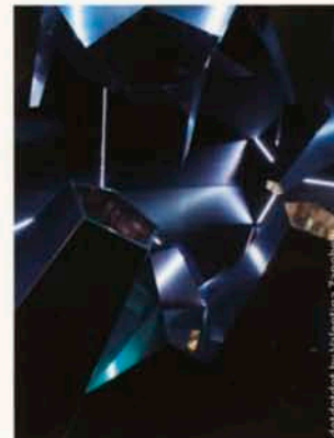
doidotdot by Valentina Zanobini