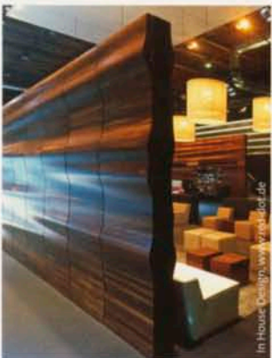
In House Design www.inhouse.de

Nothing jars. Nothing is loud. Instead, traditional and nostalgic designs are re-designed. Soft materials, gentle forms, layering, lots of cord, soft leather and long-haired fur are combined with warm wood and leather colours, grey, tan and rosewood.