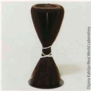
Dijana Kabiljo/Real World Laboratory