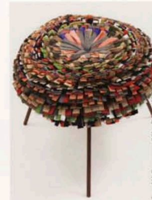
Fund H. Campagna/Vitra Design Museum