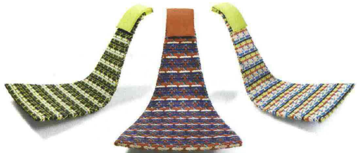
Fedro di Dedon , design di Lorenza Bozzoli, è una seduta a dondolo con struttura in alluminio e intreccio di fibra Dedon®. È disponibile in vari colori. Prezzo su richiesta.