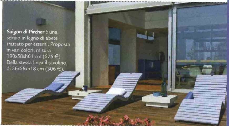
Saigon di Pircher è una sdraio in legno di abete trattato per esterni. Proposta in vari colori, misura 190x58x61 cm (576 €). Della stessa linea il tavolino, di 56x56x18 cm (306 €).