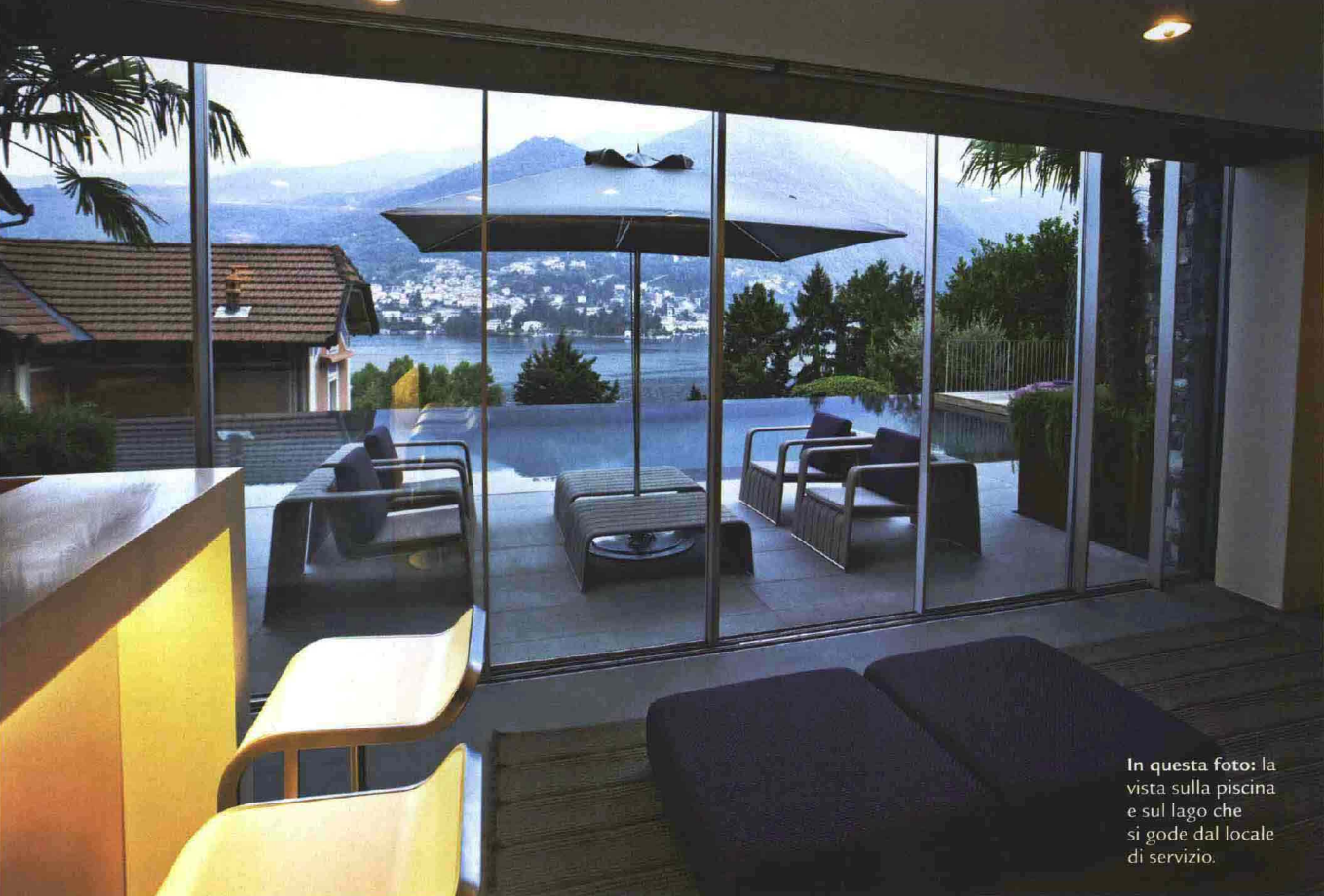
In questa foto: la vista sulla piscina e sul lago che si gode dal locale di servizio.