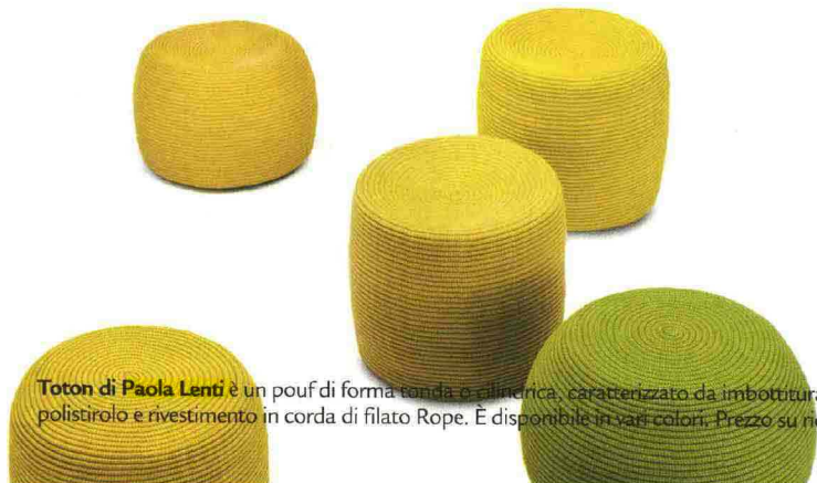
Toton di Paola Lenti è un pouf di forma tonda o cilindrica, caratterizzato da imbottitura in sfere di polistirolo e rivestimento in corda di filato Rope. È disponibile in vari colori. Prezzo su richiesta.