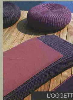
L'OGGETTO DI DESIGN