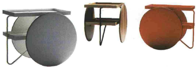
Chariot di Casamania è un carrello con struttura in metallo verniciato che funge da maniglia per sollevarlo e spostarlo, e vassoi e ruote in mdf (fibra di media densità) o rovere. Prezzo su richiesta.