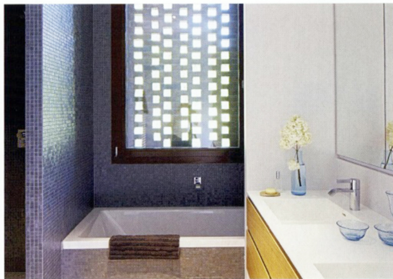
Immer mit Blick ins Grün: Das große Fenster im Essbereich orientiert sich nach Norden, wie auch das Bad mit dem Backsteingitter. Gen Süden schützt die auskragende Dachplatte vor Hitze und Regen. Zum schmalen Gartenbereich öffnen sich Schiebetüren in dunklem Eichenholz.