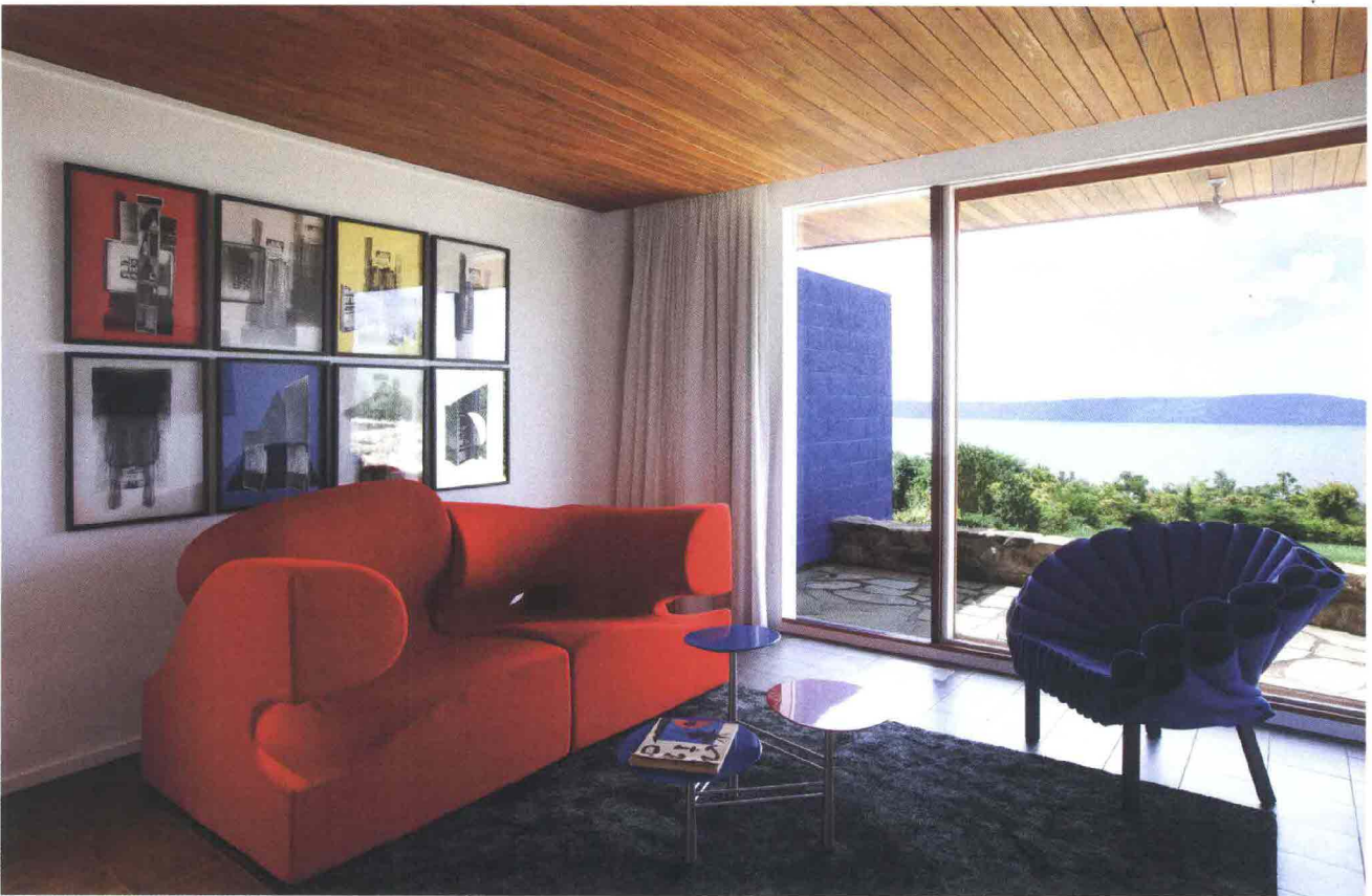
In alto, la reading room che ritrova nel colore degli arredi di design contemporaneo il vocabolario linguistico della casa. Sofa rosso Misfits di Ron Arad per Moroso , poltroncina blu Peacock di Dror Benshetrit per Cappellini , coffee table di Nada Debs. Accanto, la piscina indoor costruita in una seconda fase su richiesta di George Neumann. Lo spazio è caratterizzato da un lucernario centrale e foderato con boiserie in cedro.

Lounge chairs di Francesco Rota per Paola Lenti