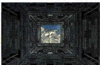
Rappresenta un'architettura trompe l'oeil il tappeto annodato a mano in lana e seta Sottosopra di Illulina, design Fabio Novembre che gioca con un effetto «vertigine»

Tappeto Mirage collezione Dance Floor di Gufram, design GGSV, con motivo effetto rilievo