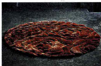
Tappeto Gift, della collezione Cameo, di Stepevi, lavorato in fibra sintetica, caratterizzato dal motivo effetto scolpitura. Personalizzabile in vari colori e dimensioni