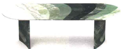
BUDRI Marea. Tavolo composto con marmo degradé