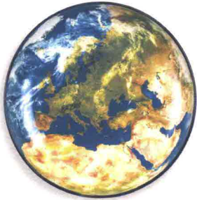
DIESEL LIVING WITH SELETTI Side doesn't matter. Piatto