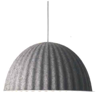
MUUTO Under the bell. Lampadario con vetro da recupero