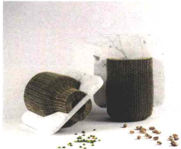
LA CASA DI PIETRA Confine. Contenitori in cartone e marmo