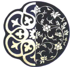
SELETTI Hybrid Andria. Tappeto in poliester e cotone