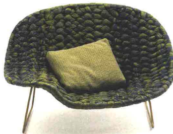
PAOLA LENTI Shito. Poltroncina in tecnotessuto mélangé