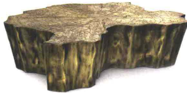
BOCA DO LOBO Eden. Tavolino in metallo simile a un ceppo