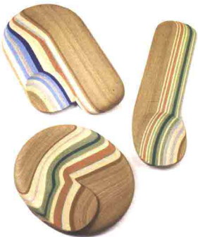
BOTTEGA GHIANDA Albura. Vassoio in legno a strati colorati