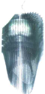
SLAMP Avia. Lampadario con lamelle di tecnopolimeri