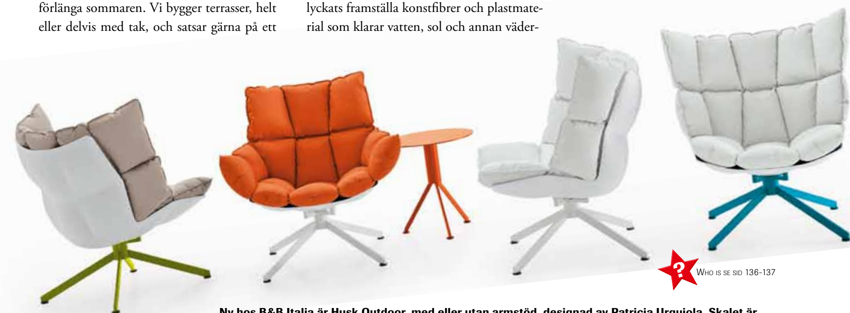
Ny hos B&B Italia är Husk Outdoor, med eller utan armstöd, designad av Patricia Urquiola. Skalet är hårt i materialet Hirek medan kuddarna är extremt mjuka. Stolens benstativ kan avvika i flera färger och de mjuka kuddarna likaså. Ett litet bord finns också som kan matcha benstativet.

Länge har man försökt hitta material som kan vara ute oavsett väder. Nu har man lyckats framställa konstfibrer och plastmaterial som klarar vatten, sol och annan väder-