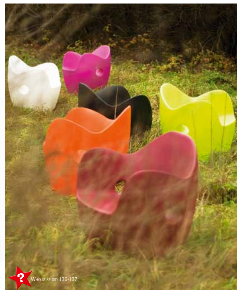
Tord Boontje har formgivit stolen O-nest för Moroso. O-nest är gjuten i färgad polyetylen. Den är vattentät och färgbeständig. Förutom dessa färger finns den i ljusblått och en mörkare orange, i allt åtta färger.