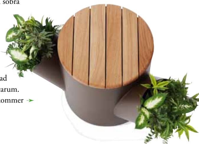
Ett fantasifullt planteringskärl är Willow, design Louise Hederström för Nola. Här med sittytta.

En typ av utemöbler som är populär i Sverige är trämöblerna av lite stabilare snitt, i naturfärgat trä eller vitmålad. Grythyttan har en rad klassiker liksom Berga Form och Byarum. Exklusiva är de terrassmöbler som kommer →