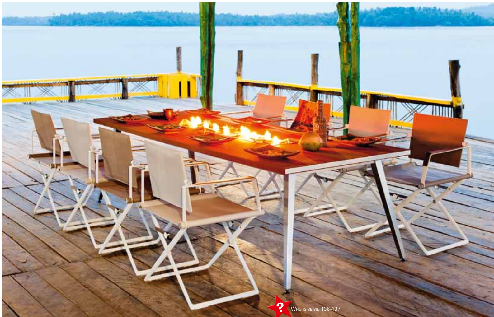
Nya Seax är en hopfällbar stol hos Dedon, designad av Jean-Marie Massaud. Seax finns i flera färger i kraftig textil och med trä på armstöden. En fotpall med kudde kan väljas till. Matbordet är också nytt och finns i flera storlekar i kollektionen Play, design Philippe Starck.

I och med att möblerna klarar hårdare väder är de alltmer intressanta också för oss. En blöt sommar kunde förstöra hela nöjet, men idag kan möbler, och till och med dynor, kuddar och plädar, tåla ganska tuffa tag. Vi svenskar har också lärt oss att förlänga sommaren. Vi bygger terrasser, helt eller delvis med tak, och satsar gärna på ett