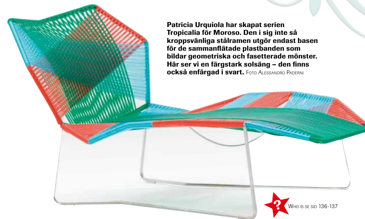
Patricia Urquiola har skapat serien Tropicalia för Moroso. Den i sig inte så kroppsvänliga stålramen utgör endast basen för de sammanflätade plastbanden som bildar geometriska och fasetterade mönster. Här ser vi en färgstark solsäng – den finns också enfärgad i svart.