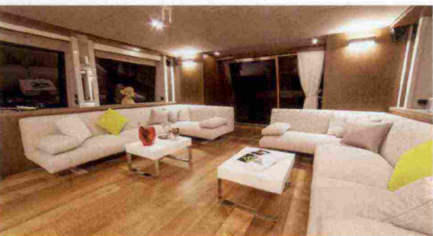
Amer Cento Quad Ips, Amer Yachts/Permare srl