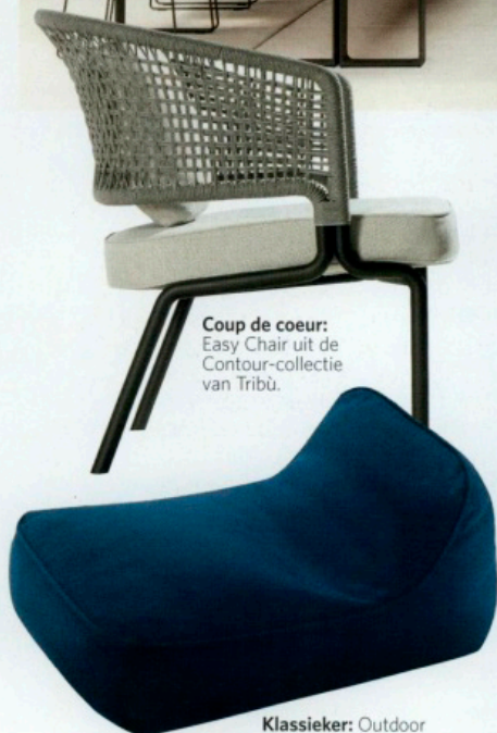
Coup de coeur: Easy Chair uit de Contour-collectie van Tribù.