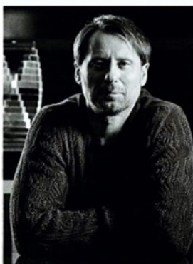
Портфолио архитектора http://archiprofi.ru/allportfolio/dmitry-pozarenko/

«Вдохновением при проектировании этого дома послужили старинные каменные амбары, поэтому стены были выполнены из местного башкирского сланца. В оформлении бассейна также активно использовано натуральное дерево—ещё один реверанс в сторону традиционной архитектуры. Красным деревом отделаны стены бассейна. Древесина ипе использована на примыкающей к бассейну просторной террасе, стены обшиты мербау, потолок—меранти. Эти породы отличаются по фактуре, но у всех—сближенный красновато-коричневатый цвет».