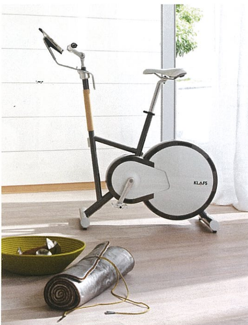
Ergometer ACT-210: So stilvoll lassen sich Design und Sport verbinden.