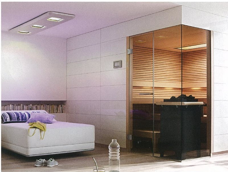
SONNENWIESE® in Snow-Metallic, angebracht über der Pendelliege SWAY.

Für das Plus an Entspannung sorgt SWAY, die Entspannungsliege von KLAFS. Ihre sanften Pendelbewegungen wiegen Sie in einen erholsamen Kurzschlaf, aus dem Sie tiefenentspannt erwachen.