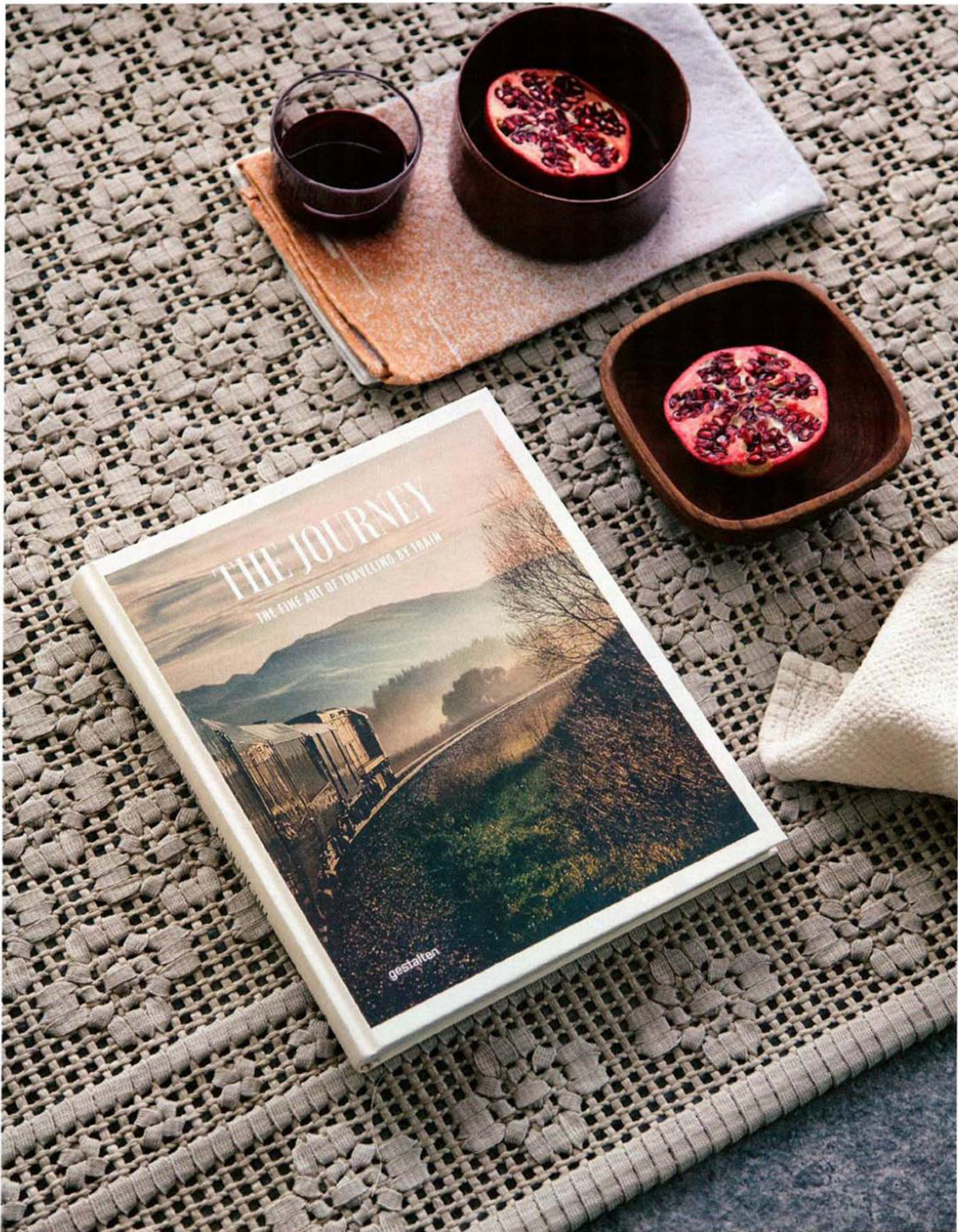
Tapijt Giardino van Paola Lenti via 't Huis van Oordeghem (prijs op aanvraag, hvo.be) - Boek The Journey bij Espoo (€ 39,90, espoo.be) - Linnen van Society Limonta (prijs op aanvraag, societylimonta.com) - Theedoek van Mae Engelgeer bij Espoo (€ 20, espoo.be) - Glazen Corky van Muuto bij Espoo (€ 35 per set van 4, espoo.be) - Keramiek van Sandra Lintermans bij Serie 20 (bowls vanaf € 23, serie20.com) - Vintage houten schaalje van Jessica Lehtikoinen bij Serie 20 (€ 10, serie20.com)