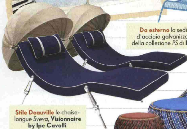
Stile Deauville le chaise-longue Sveva, Visionnaire by Ipe Cavalli.