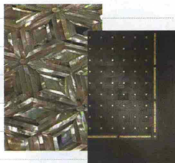
Intarsi preziosi. Il mosaico Queen Of Gems di Fantini è di madreperla e ametista. Il pavimento Glitter Glam di Parquet In è di wengé e ceramica oro.

Cinematografica (cioè, da regista) la sedia in fibra di plastica, disegnata da Stefano Gallizioli per Coro Italia. Inevitabile il nome: «Fellini Collection».