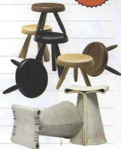
Si assomigliano gli sgabelli Tabouret Berger di Cassina, e quelli impunturati firmati dalla collettiva The Threads That Bind Us per Plus Design Gallery a Lambrate.